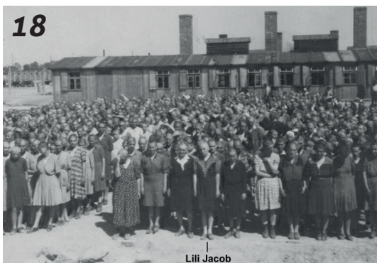
Židovské ženy při nástupu před proměnou ve vězně