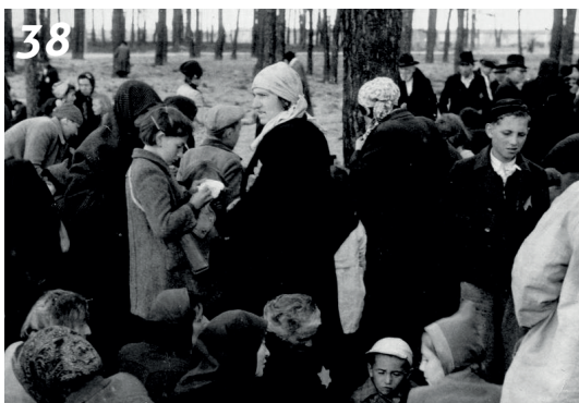
Židé v lese před poslední cestou do plynových komor