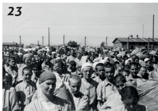
Židovské vězeňkyně v ženském táboře