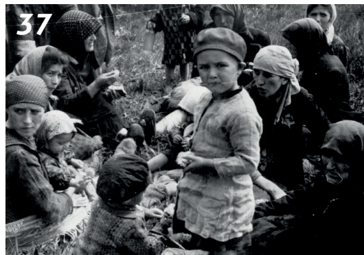
Židé v lese před návštěvou „sprch“, v blízkosti krematoria