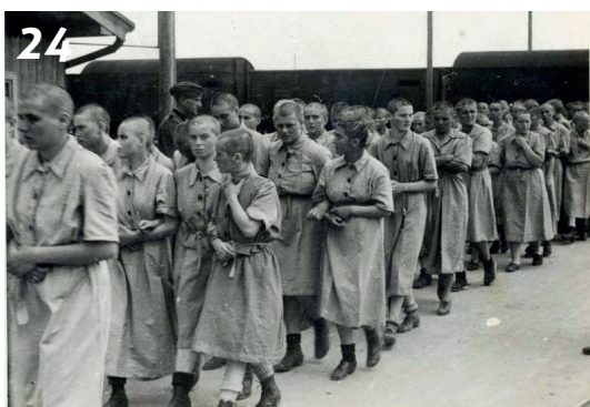
Židovské ženy jako vězeňkyně