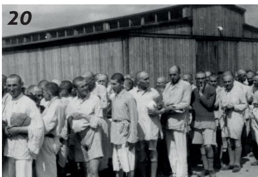
Židovští muži na konci procesu jako vězňové